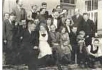
von oben: Gründerhaus 1933 Arbeitslosenlager Emigranten 1939