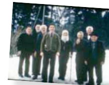
Teilnehmer einer Appenzeller Weihnachtswoche

Einheimische Handwerker errichten 1944/45 zusammen mit 73 Flüchtlingen aus 14 Ländern ein zweites Haus